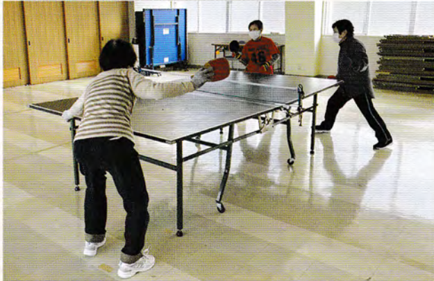
毎週練習は欠かせません。

ピンポン台中古ですがいただきました。来年は、絶対大会を開催します。腕に覚えのある方は、是非参加を!