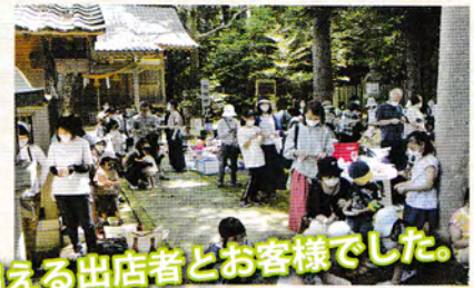
予想を超える出店者とお客様でした。

ジャンケン大会・ビンゴ大会の景 品を沢山用意できました。これだ けの町民の皆さんがこの境内で楽 しむことは、昔茶碗祭りと神楽山 での相撲大会が開催されて以来の 大盛況でした。