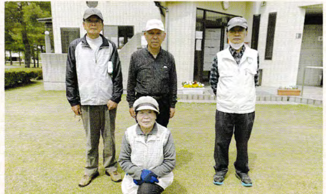
入賞者集合写真ですが、2人足りない!!