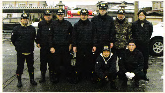
2013年の消防団のメンバー