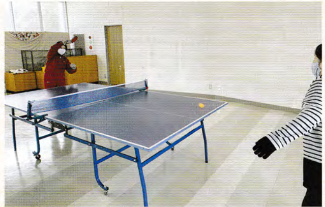
寒くても楽しいです!