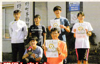
駅伝も佐野町は強し! 2位となり、2人区間賞を獲得しました。