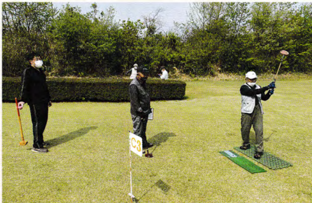
コロナ禍でも練習を欠かせません。 優勝目指しホールインワン!?

グラウンドゴルフ大会 26名の参加ですが 20~40代の親子の皆さんの参加も お願いします。